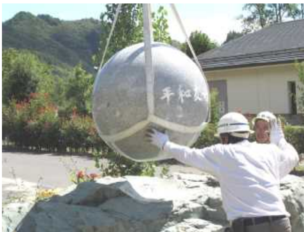
写真 10トンの台座に据え付け中の平和友好の石碑