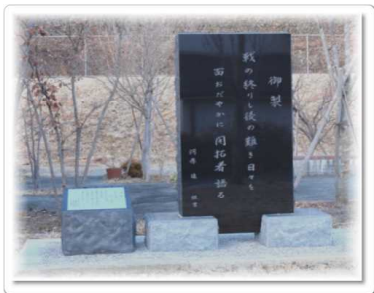
御製の石碑 …… 10p