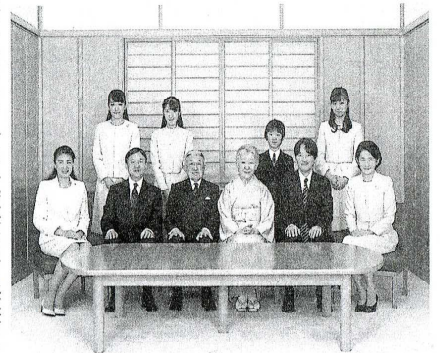
新年を迎える天皇ご一家

宮内庁は新年にあたり、天皇、皇后両陛下が昨年 1 年間に詠んだ歌から両陛下が選んだものを発表した。天皇陛下が同庁を通じて毎年公表してきた「新年にあたってのご感想」は、公務負担軽減策の一環で今回から取りやめた。