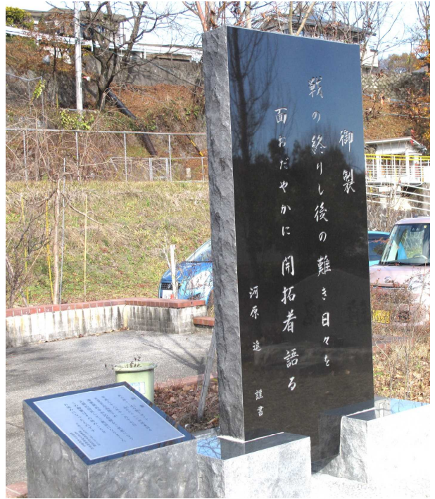
〈写真：初代館長「河原 進」揮毫による御製碑〉

「満蒙開拓平和記念館」を訪問された、天皇・皇后両陛下は、館長はじめ寺沢副館長、三沢事務局長のご案内で館内を見学された後、寺沢副館長（開拓団員子息）と共に「体験者（語り部）3名」から当時の様子をお聞きして懇談された。