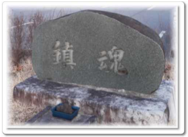
鎮魂の石碑 …… 6p