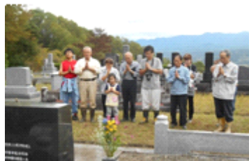
(左写真 清掃後全員で墓参)